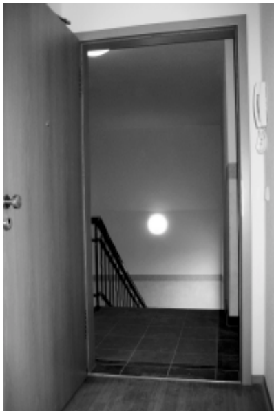
Blick ins Innere der Stadtvilla.